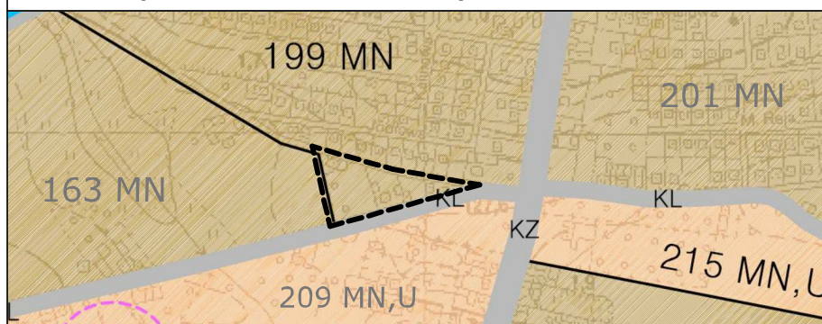
Wyrys ze Zmiany studium uwarunkowań i kierunków zagospodarowania przestrzennego Miasta Skierniewice